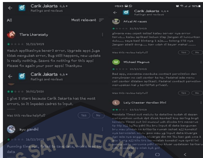
Gambar 1.2 Komentar Penggunaan Aplikasi "Carik Jakarta" di Google Play Store