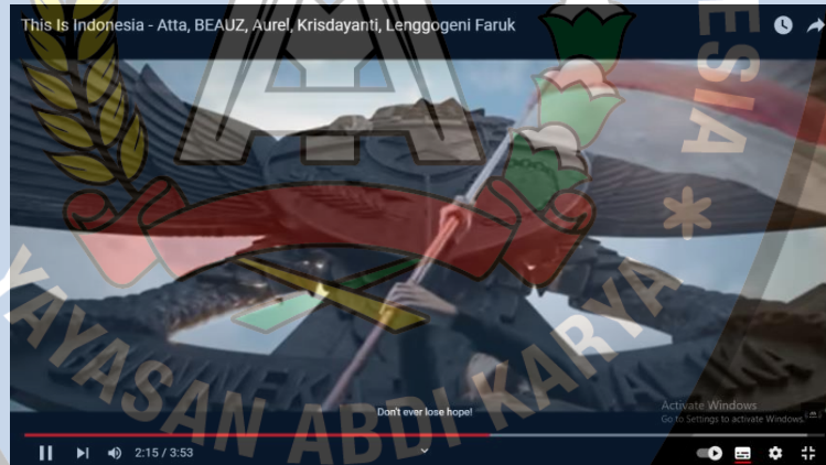
Gambar 1.1 Youtube AHHA RECORDS

Berdasarkan penjelasan di atas, dapat disimpulkan bahwa representasi merupakan gabungan dari makna dan bahasa. Representasi juga bisa mengatakan sesuatu yang bermakna maupun mewakili dunia yang penuh arti kepada orang lain.