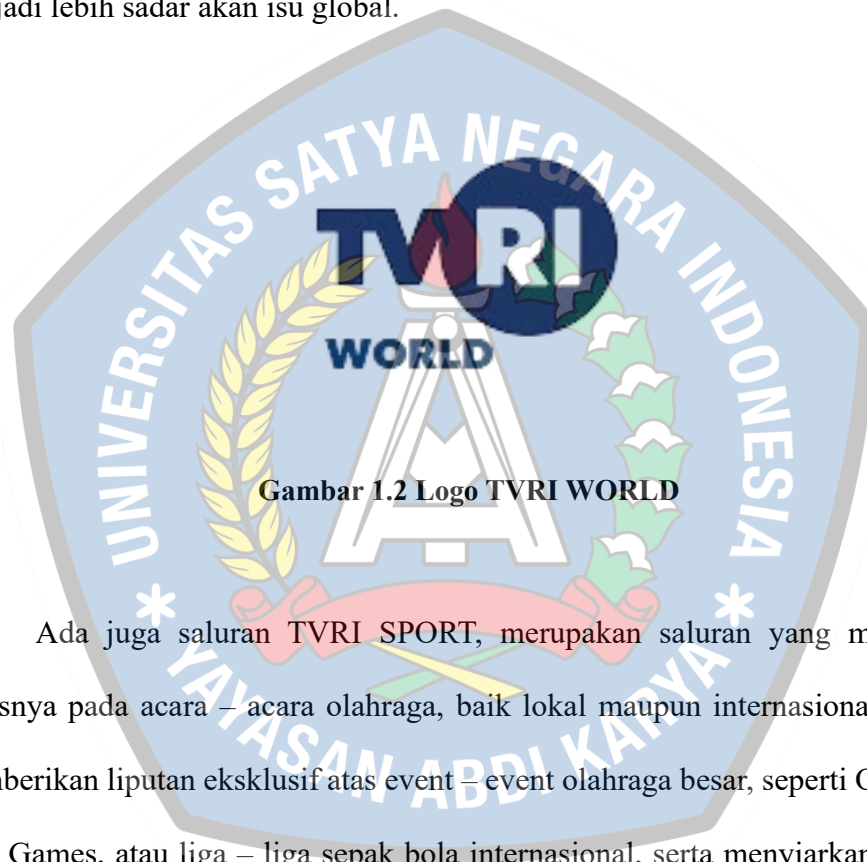
Gambar 1.2 Logo TVRI WORLD

Seperti halnya TVRI WORLD, merupakan saluran penyajian berita dan program tentang peristiwa internasional serta wawasan global. Konten – konten yang ditawarkan bisa berupa dokumenter, wawancara dengan tokoh – tokoh, serta analisis mendalam tentang isu – isu global. Dengan menyediakan konten yang informatif dan mendidik, TVRI WORLD dapat membantu masyarakat Indonesia menjadi lebih sadar akan isu global.